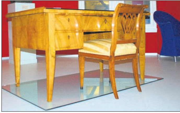
Das Literaturmuseum ist in der Karlstraße 10 zu finden.

Ein weiterer Schwerpunkt liegt in der Darstellung speziell von Karlsruher Literatur: Den Schriftstellern Johann Peter Hebel und Joseph Victor von Scheffel ist jeweils ein gesondertes Kabinett gewidmet – ihre Biografien sind eng mit der Stadt verknüpft. Um das Ganze ein wenig von der rein schriftlichen Ebene wegzubringen und die Präsentation aufzulockern, werden viele Tondokumente und Filmmaterial angeboten. Ebenfalls sind über 400 in diesen Räumen abgehaltene Lesungen regionaler und überregionaler Autoren zum Nachhören verfügbar. Für einen individuell zusammenstellbaren Rundgang steht ein Audioguide zur Verfügung, es gibt auch eine Fassung speziell für